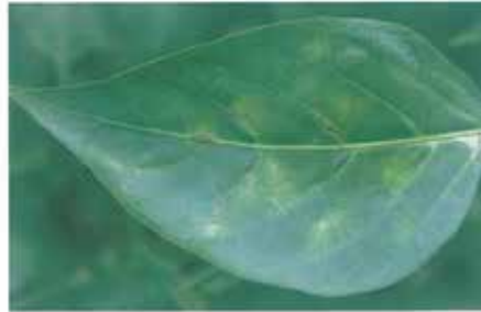
Biber küllemesi ( Leveillula taurica )