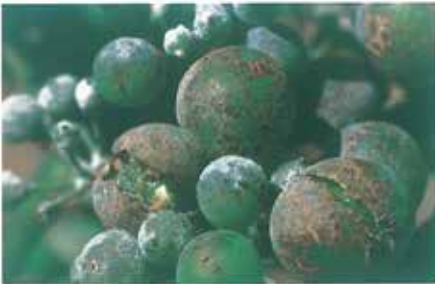
Bağ küllemesi ( Uncinula necator )