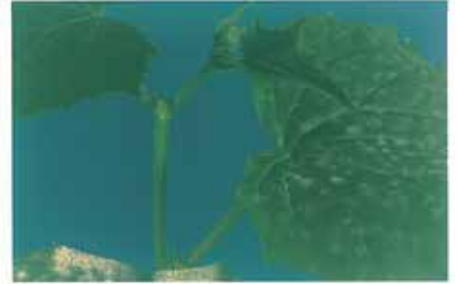
Kavun küllemesi ( Sphaerotheca fuliginea )