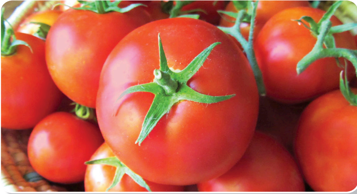
Vivando® hem koruyucu hem de tedavi edici özelliğindedir.

Metrafenone, koruyucu ve önleyici etkiye sahip Benzophenone grubunun ilk aktif maddesidir. Yaprak kütikulasından kolayca ve hızlı bir şekilde alınmakta, yaprak dokusu içerisinde ilacın değdiği bölgenin altında toplanmaktadır. Hastalığın yaprağa bulaşmasını, nüfuz etmesini, misel ve spor gelişimini önler.