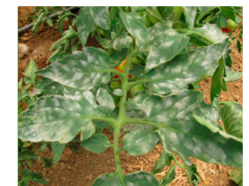
Domates Küllemesi ( Leveillula taurica )