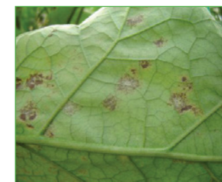
Patlıcan küllemesi ( Leveillula taurica )