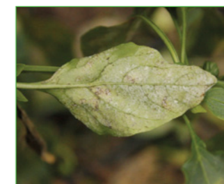
Biber küllemesi ( Leveillula taurica )