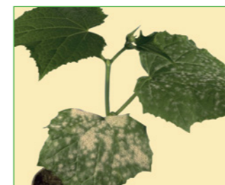
Hıyar küllemesi ( Sphaerotheca fuliginea )