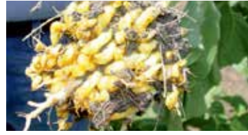
Orabans (Canavar otu) ( Orabanche cernua )