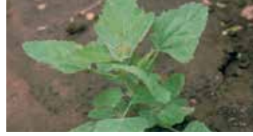
Sirken ( Chenopodium album )