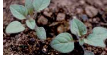
Köpek üzümü ( Solanum nigrum )