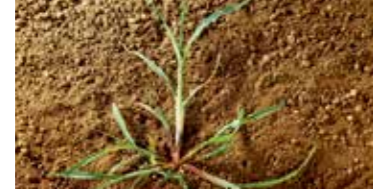
Dancan ( Echinochloa crus-galli )