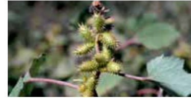
Domuz pitrağı ( Xanthium strumarium )