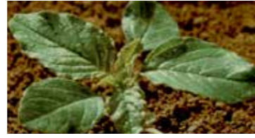
Horoz ibiği ( Amaranthus albus )