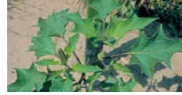
Şeytan elması ( Datura stramonium )