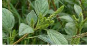
Kırmızı köklü tilki kuyruğu ( Amaranthus retroflexus )