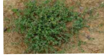
Çoban değneği ( Polygonum aviculare )