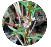
Güvercin Ayağı ( Ammania coccinea )