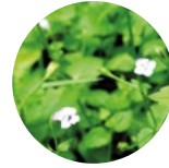
Dipotu ( Lindernia procumbens )