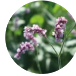
Su Biberi ( Polygonum hydropiper )