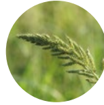
Darcan ( Echinochloa crus-galli )

Beyond® New , sadece kırmızı çeltiği ( Oryza sativa var. sylvatica ) kontrol etmekle kalmaz, aynı zamanda Clearfield® çeltik üretiminde istenmeyen diğer yabancı otların da kontrolünü sağlar.