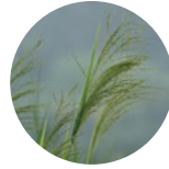
Baraj Otu ( Diplachne fusca )