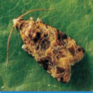
Salkım Güvesi Ergini