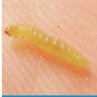
Salkım Güvesi Larvası