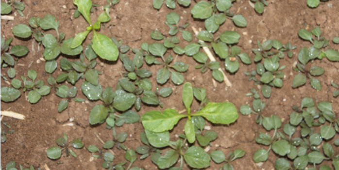
BİTKİ KORUMA ÜRÜNÜ UYGULANMAMIŞ ALAN