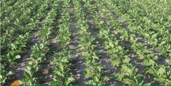
KEZURO® (350 ml/da) UYGULANMIŞ ALAN