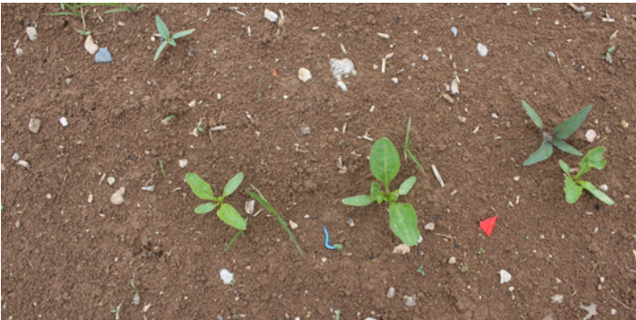
KEZURO® (350 ml/da) UYGULANMIŞ ALAN