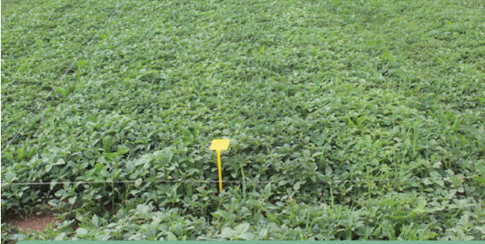
BİTKİ KORUMA ÜRÜNÜ UYGULANMAMIŞ ALAN