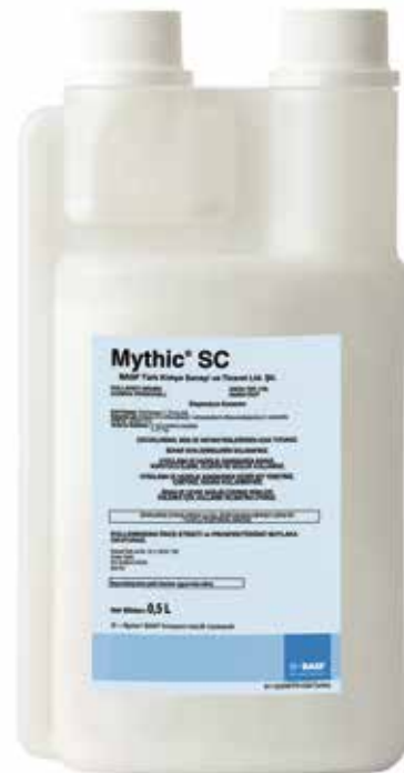
Mythic® SC 0,5 lt ambalajdadır.

Diğer insektisitlere direnç geliştiren popülasyonlar üzerindeki yüksek etkinliği sayesinde; pest kontrol profesyonelleri için değerli bir araçtır.